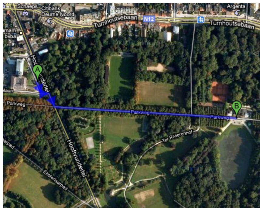
Figure 2: Wandeling van de parkeerplaats naar het kasteel.

Indien u pas na 22:30 aankomt, is er een grote kans dat de ingang van het Rivierenhof tegenover het districtshuis al gesloten is. Kijk even terug naar Figuur 1. om te zien welke ingang(en) wel open zijn.